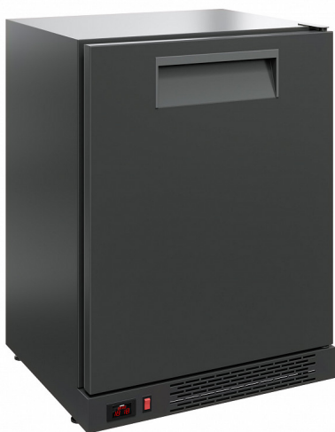
Стол барный TD101(гл дверь без стол-цы)

Уникальная модель однодверного стола, подходящего как для использования в качестве традиционного холодильного стола с объемом хранения охлажденных продуктов и полноценной столешницей, так и для встраивания в барные стойки, пристенные модули, под общую столешницу, в ниши и в элементы мебельных и строительных конструкций. Для удобства встраивания под общую столешницу поставляется без собственной столешницы. Цельнозаливные корпус и дверь обеспечивают отменную теплоизоляцию. динамическая система охлаждения гарантирует равномерное холодоснабжение продуктов.